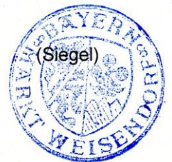
Heinrich Süß Erster Bürgermeister

Auszug aus der Schöffenbekanntmachung vom 07. November 2012 (JMBl. S. 127) zuletzt geändert am 25. Oktober 2017, Az. E8 - 3221 - II - 418/91 und IB2 - 0143 - 1 - 4